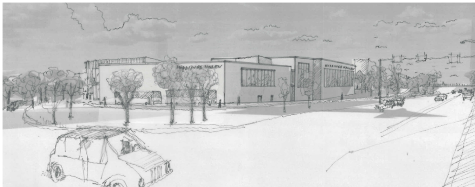
Perspektiv från Huddingevägen i korsningen Björkängsvägen/Huddingevägen.