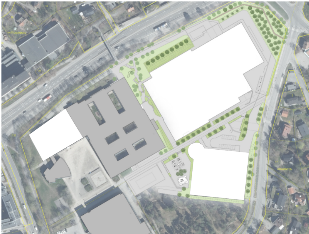
Illustrationsplan över möjlig utformning, Wii Landskap.

Detaljplanen syftar till att möjliggöra byggnation av en ny simhall samt flertalet hallar för diverse idrottsfunktioner ( Nya Huddingehallen ). Detaljplanen syftar också till att möjliggöra utveckling på platsen utan att en övergripande omvandling av gymnasieområdet hindras.